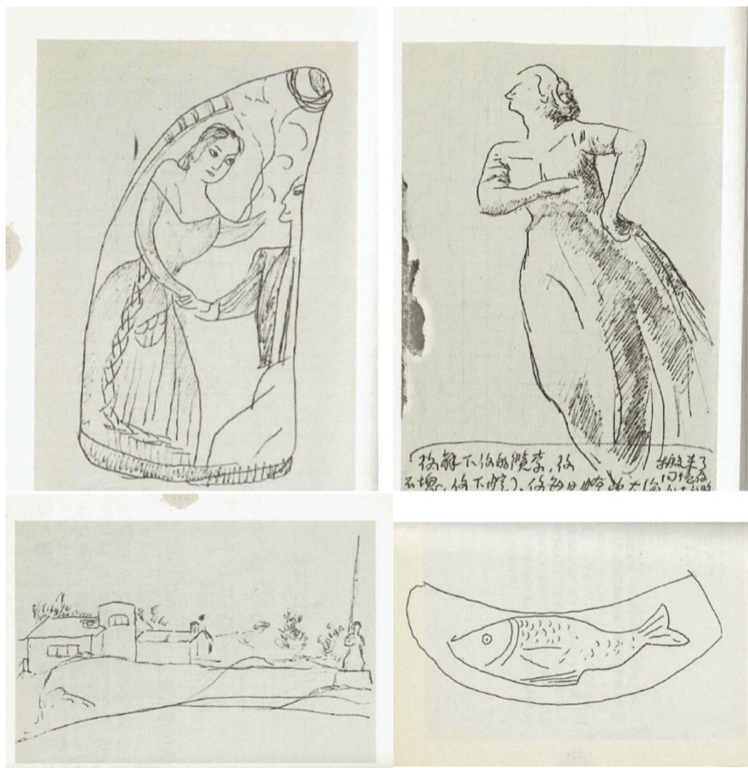
Figura 1. Bosquejos de la casa de Neruda en Isla Negra en Diario de viaje

Emocionado ante el paisaje costero, Ai Qing le preguntó a Neruda: “¿Eres marinero o capitán?” Y este le respondió: “Soy capitán, como tú, pero mi barco ya desapareció, ya se hundió” ( Diario de viaje 207). Esa noche Ai Qing compuso el poema “En la punta de Chile—A Pablo Neruda” (“Zai zhili de haijia shang—gei baboluo nieluda”, 《在智利的海岬上——给巴勃罗·聂鲁达》), considerado como su poema más destacado después de la década de los cincuenta. Dado el carácter privado del diario, en este poema el poeta dejó plasmado, con un registro espontáneo, el momento vivido con Neruda aquel día, lanzando las siguientes preguntas: