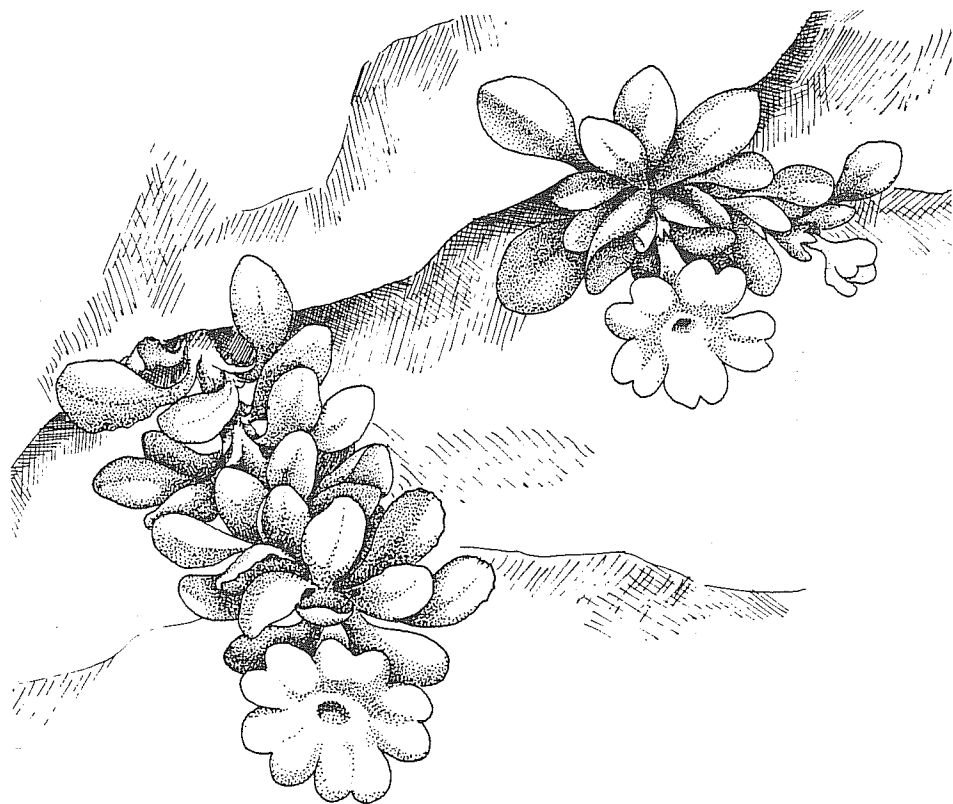
Fig. 1 - Primula allionii Loisel (dessin par Maria Luisa Bentivoglio).

de la roche calcaire nue et les chaudes tonalités rosé-amarante des corolles des primevères a un incroyable pouvoir de suggestion.