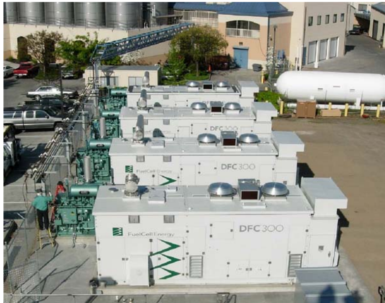
Abbildung 1: Die vier FuelCell Energy Inc. Hochtemperatur-Schmelzkarbonat-Brennstoffzellen, installiert von Alliance Power mit einer Gesamtleistung von 1 MW (Stadler et al., 2006).

Unterstützung kam auch vom Climate Change Fuel Cell Programm des U.S. Department of Defense.