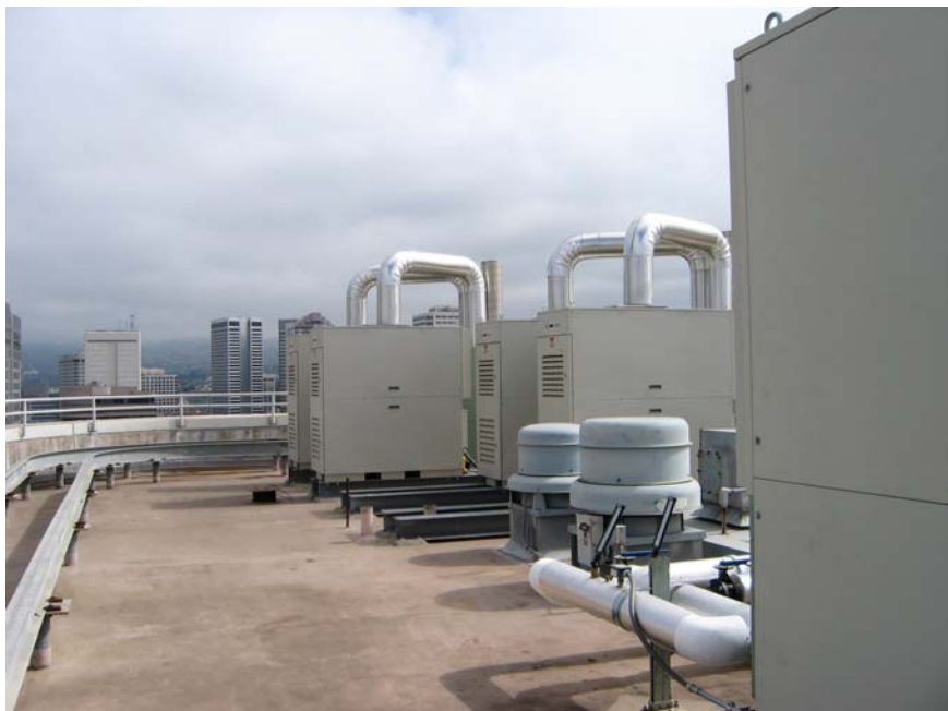
Abbildung 2: Vier der zehn Capstone Mikroturbinen am Dach des Bürogebäudes in Oakland.

Das System besteht aus zehn 60 kW Capstone Mikroturbinen und einer 633 kW Absorptionskühlanlage von YORK. Ursprünglich wurden auch Brennstoffzellen bei der Planung berücksichtigt, aber aufgrund des großen Gewichts verworfen. Letztendlich wurden die leichteren Mikroturbinen am Dach des Gebäudes montiert, welche aufgrund der niedrigeren Emissionen regulären Gas-Verbrennungsmotoren vorgezogen wurden. Das System produziert genug Abwärme um 60% der Kühllast, welche ursprünglich durch einen 880 kW Kompressorkühler gedeckt wurde, zu liefern.