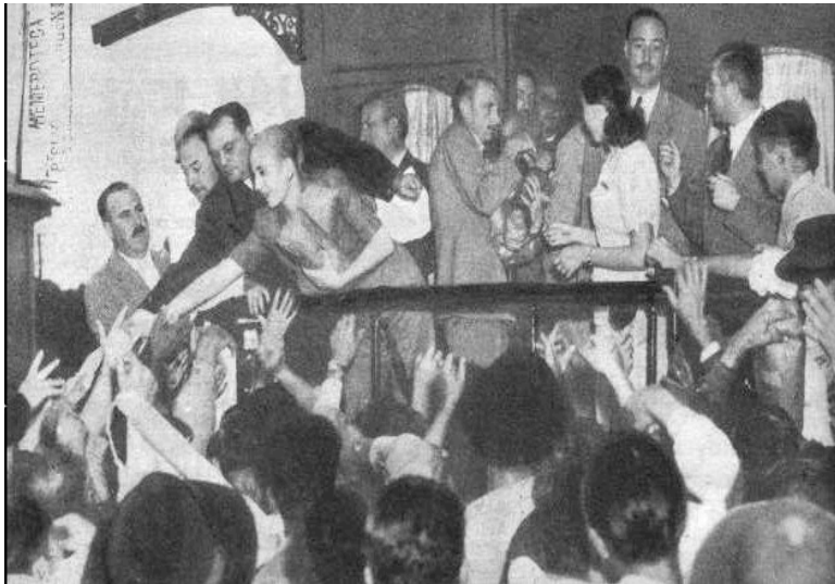
F. 7 Eva Perón saludando a bordo del tren durante la campaña electoral de 1946.