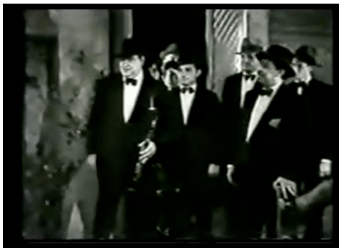
F.2 Primera escena: Los “cajetillas” visitan al Malandra