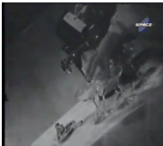
F.3 Plano medio de manos obreras