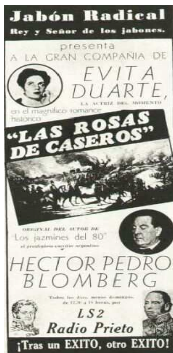
F.6 Publicidad para el programa radioteatral "Las Rosas de Caseros," en 1939.