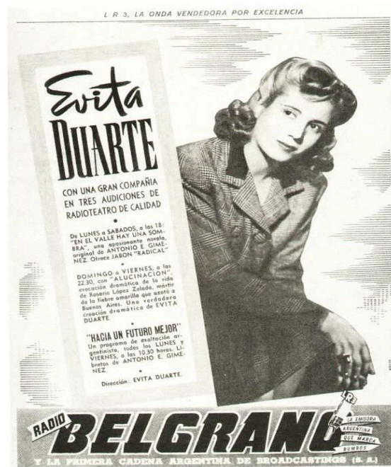
F.5 Radiolandia, año 1944. Instituto Nacional de Investigaciones Históricas Eva Perón