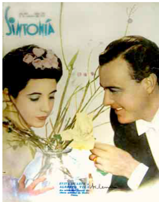
F.4 Sintonía , 25 de octubre de 1939. Archivo Familia Duarte