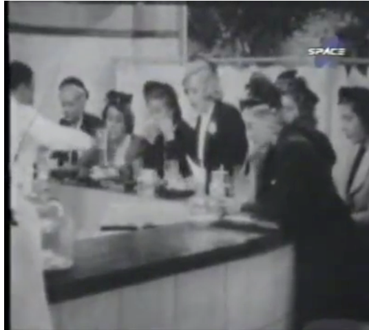
F.6 Plano colectivo de las vendedoras en la lechería