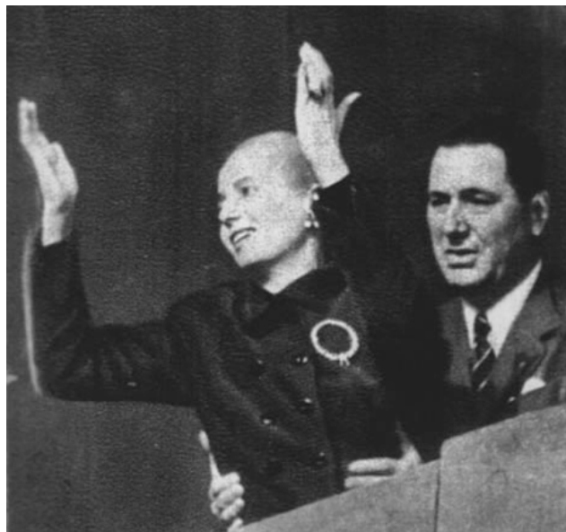
F.8 Eva Perón en el acto de conmemoración del Día de Lealtad Peronista. 17 de octubre de 1951.