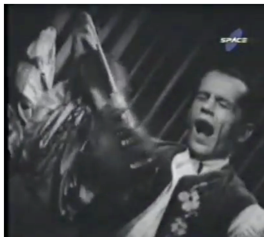
F.2 Violinista bostezando en el boite por su larga jornada de trabajo