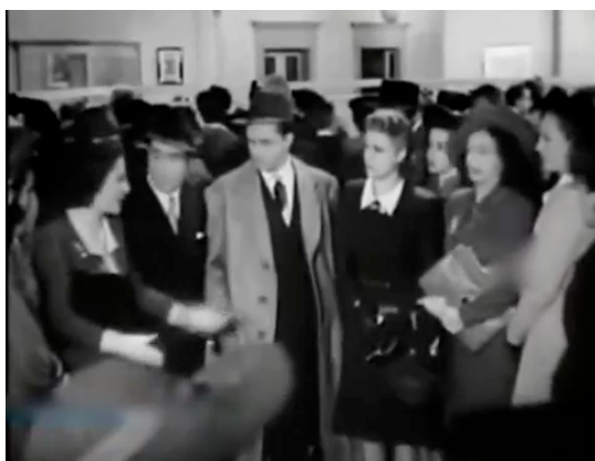
F.12 Escena en la ventanilla de pago: alboroto por descuentos y despidos injustos