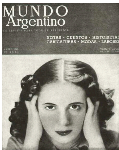
F.2 Mundo Argentino , 3 de abril de 1940.