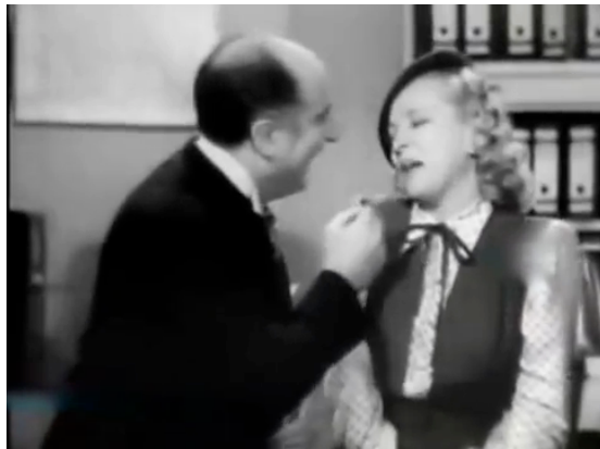
F.20 Bastistella acosando a Elvira sin conocer su verdadera identidad