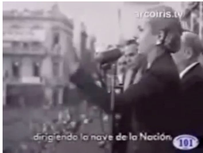
F.9 Eva Perón pronuncia su discurso en el Cabildo Abierto del Justicialismo. 22 de agosto de 1951