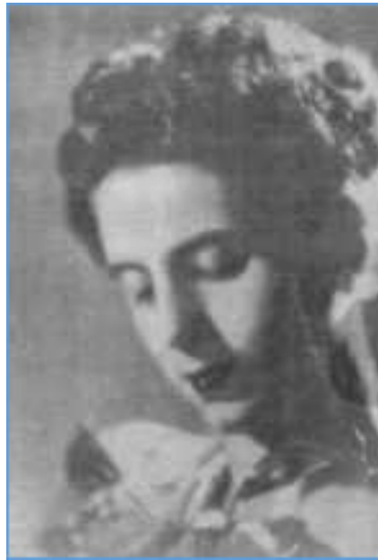
F.3 Foto artística aparecida en 1939, promocionando su actuación en el radioteatro “Las Rosas de Caseros”.