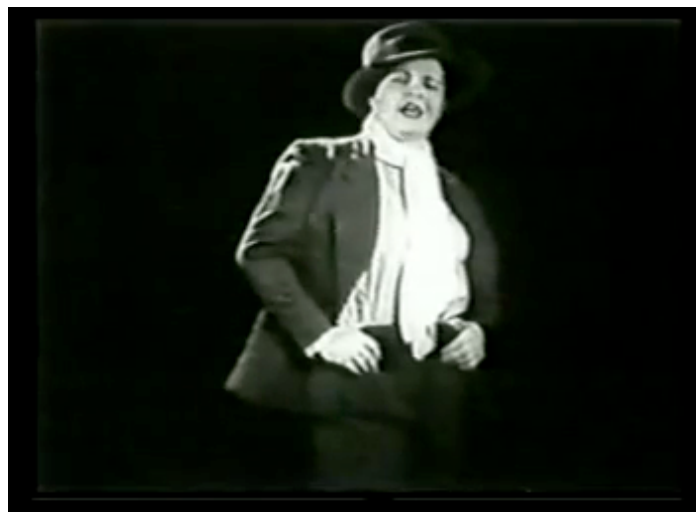
F.6 Performance final de Azucena Maizani “Milonga del Novecientos”