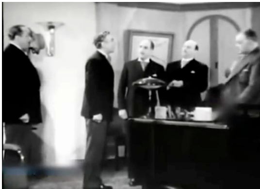
F.11 Primera escena: directores de las “tiendas Durand” reunidos en la oficina de su propietario