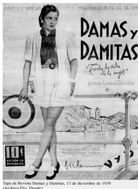
F.1 Damas y Damitas , 13 de diciembre de 1939.