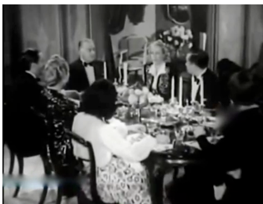
F.14 Lujoso comedor al interior de la casa de Durand