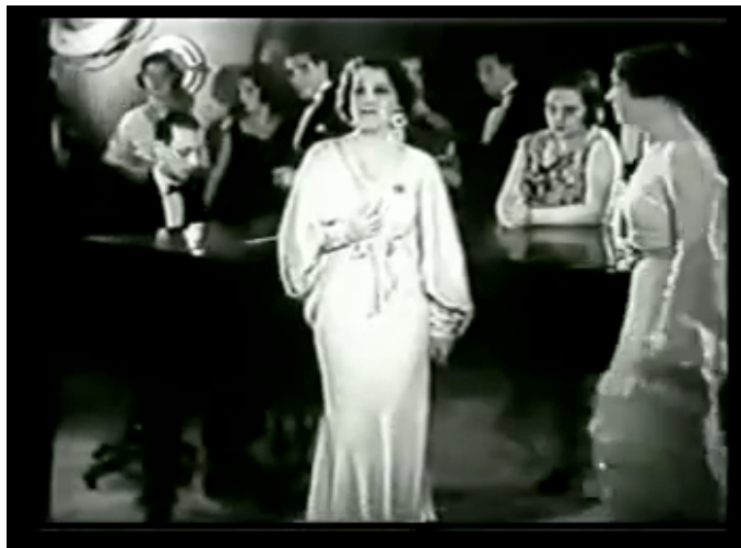
F.5 Escena del “barco”: performance de Libertad Lamarque “Andate, no te vayas”