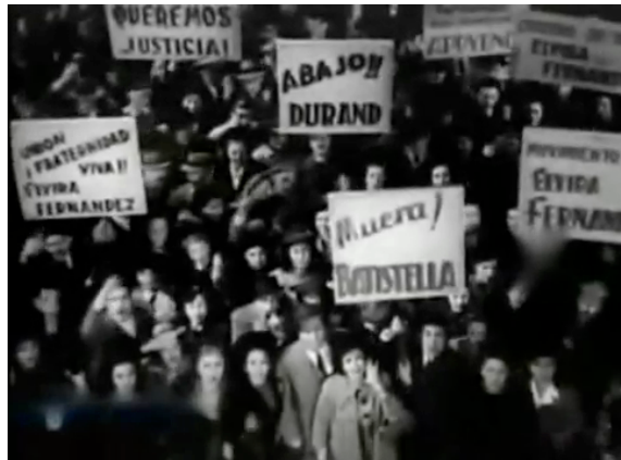
F.17 Plano inclinado de la huelga en frente de la casa de Durand