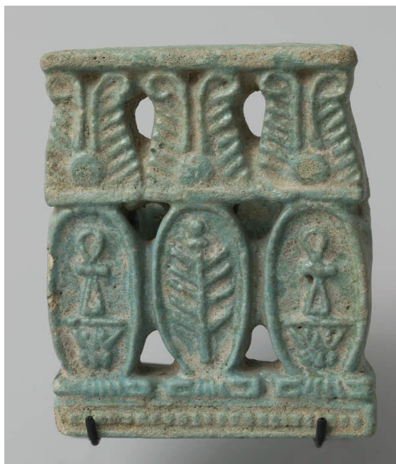
Fig. 7 et 8. Plaquette-agrafe vestimentaire, E 11390.