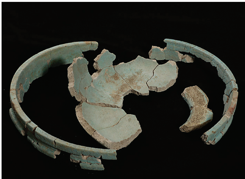
Fig. 3. Coupe à gorge, E 32531.