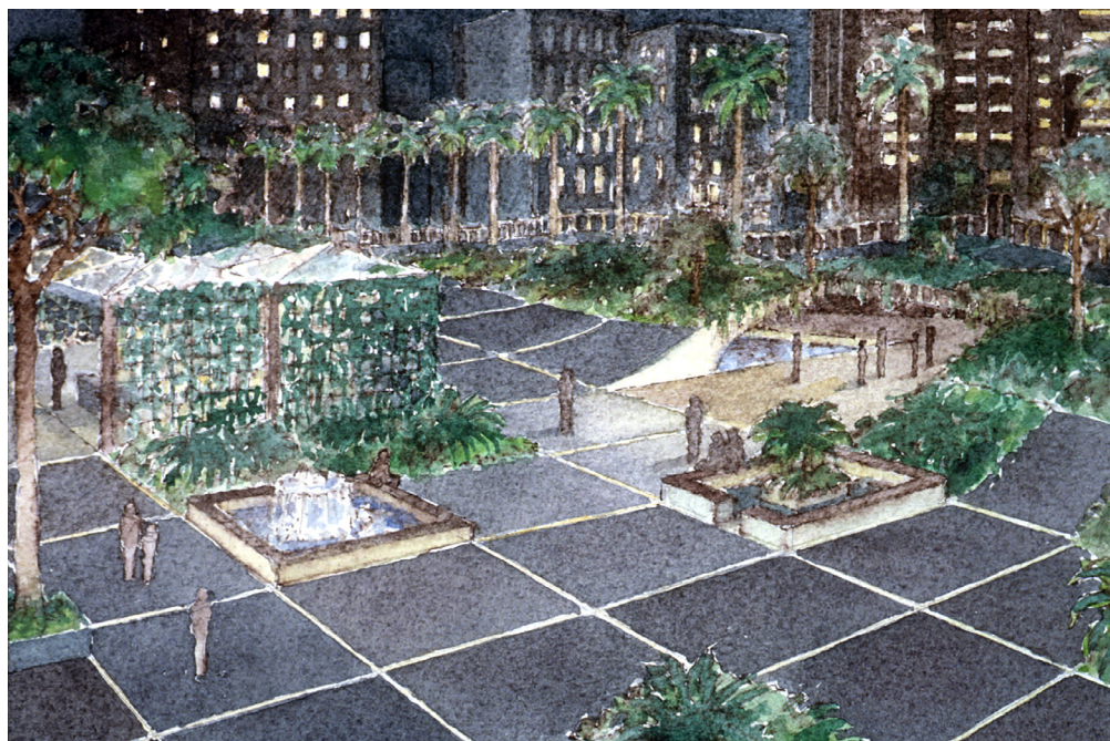
Figure 5. Watercolor by James Wines showing park activities at night with illuminated grid. (Image: Courtesy of SITE - James Wines Design.)