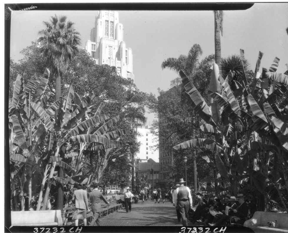
Figure 1. Pershing Square, circa 1935.

En este artículo, repaso la historia del diseño y la planificación de Pershing Square, adoptando el enfoque de un periodista e historiador mediante la revisión de informes periodísticos y archivos de diseño y planificación, realizando entrevistas selectas a profesionales actuales del diseño y de la planificación. Examinó los eventos y las batallas que rodean los esfuerzos para controlar su diseño y uso a la luz de los esfuerzos cívicos y privados más amplios para reconstruir el centro de Los Ángeles y restablecerlo