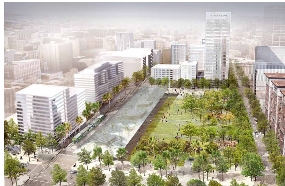
Figure 7. Rendering of Agence Ter's 2016 competition design. Aerial view looking north.

Se eligieron diez equipos para desarrollar conceptos de diseño y presentaron sus vision boards en una reunión en diciembre de 2015. De esta lista