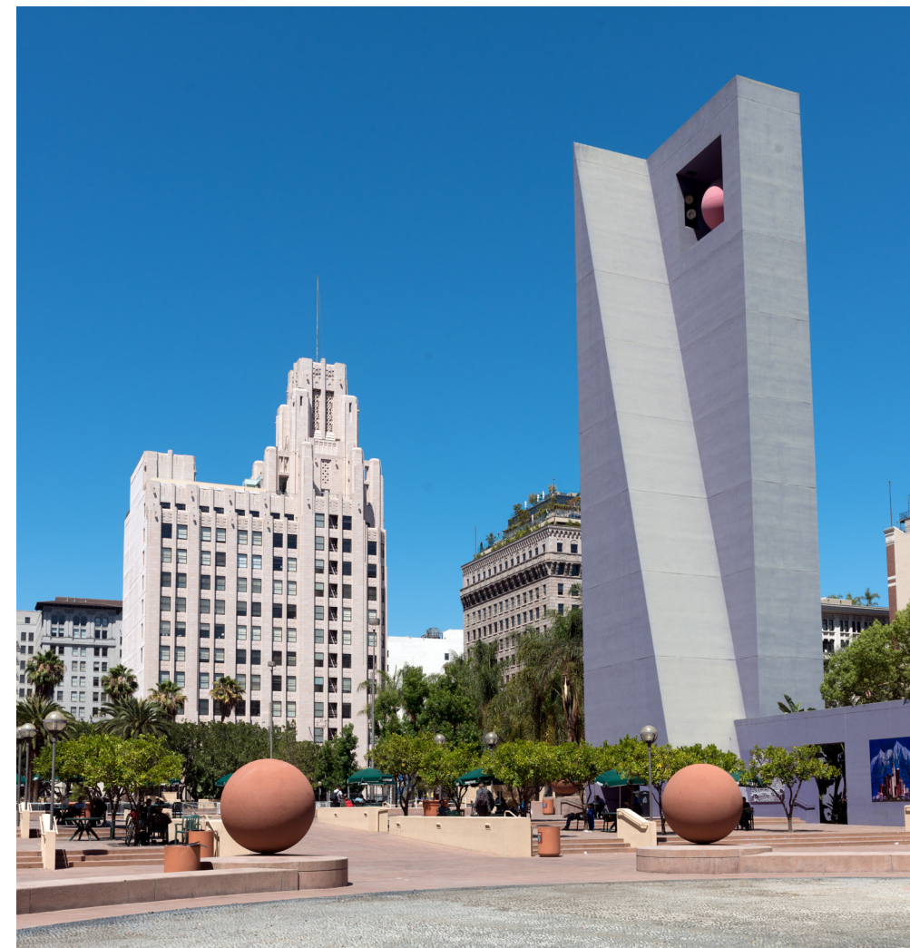
Figure 6. View looking north of Legorreta and Olin’s 1994 design, circa 2012.

the administrator of New York’s Bryant Park pointed out that the Los Angeles Department of Recreation and Parks was cash-strapped and wouldn’t be able to devote the care for maintenance and programming that Pershing Square would need (Gordon 1994). Leon Whiteson, critiquing the design for the Los Angeles Times, wrote: