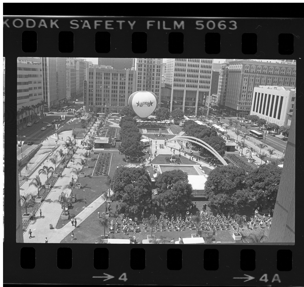
Figure 3. Rededication of Pershing Square, 1984.

and fields of marigolds and petunias were planted, the two pools were cleaned, and a temporary bandstand and hot-air balloon staged at the park heralded the arrival of the Olympics when the park reopened in July (Soble 1984a; Belcher 1984; Skelton 1985) (Figure 3).