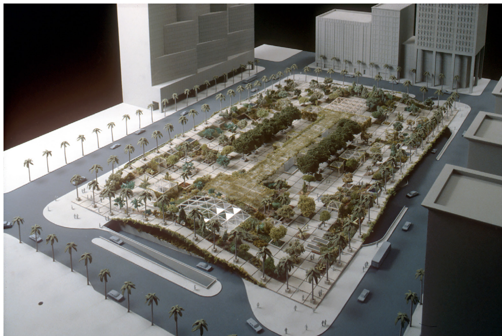
Figure 4. Model of the winning design of the 1986 PSMA competition by SITE - James Wines.