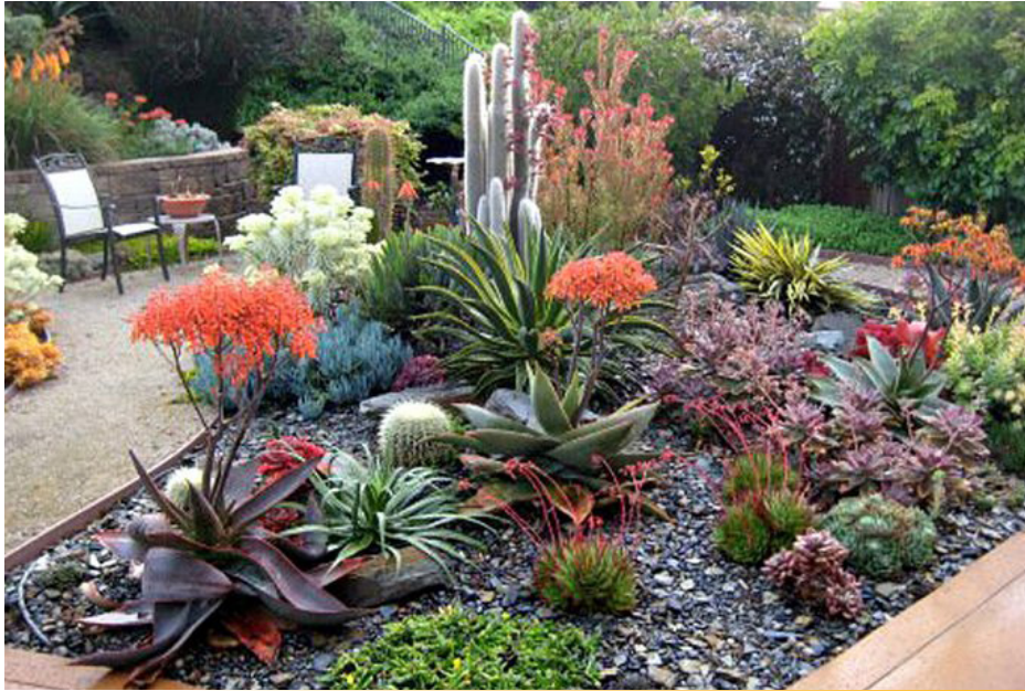
Figura 6. Una capa de 3 pulgadas de virutas de madera ayuda a ahorrar agua, reduce las malezas y detiene el escurrimiento.

mantillo por lo menos 1 pie alejado del tronco de los árboles para evitar la humedad en los troncos y coronas, los cuales podrían ser sujetos a patógenos que causan enfermedades.