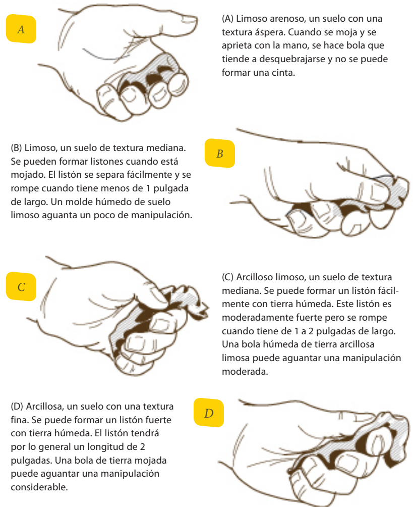
Figura 4. Determinando la textura de la tierra con el método de tacto.

muy arcilloso. Esto reduce el desperdicio de agua y la posibilidad de contaminar el agua subterránea con los fertilizantes y pesticidas que se filtran por debajo de la zona de raíces en suelos arenosos y el escurrimiento de agua y químicos en la superficie en los suelos arcillosos. Use el método de tacto (fig. 4) para determinar la textura