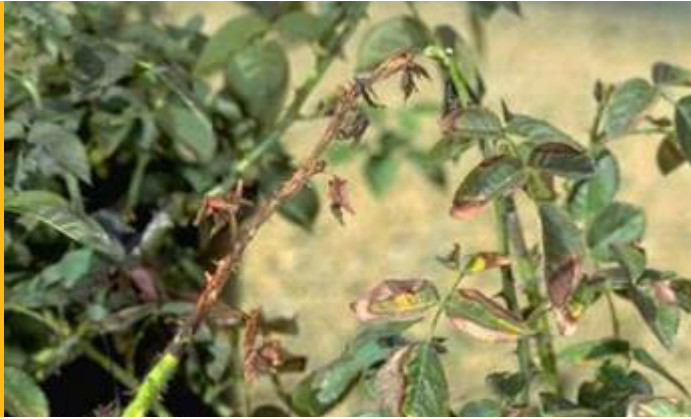
Figura 2. Daño por sequía a las hojas de un rosal.