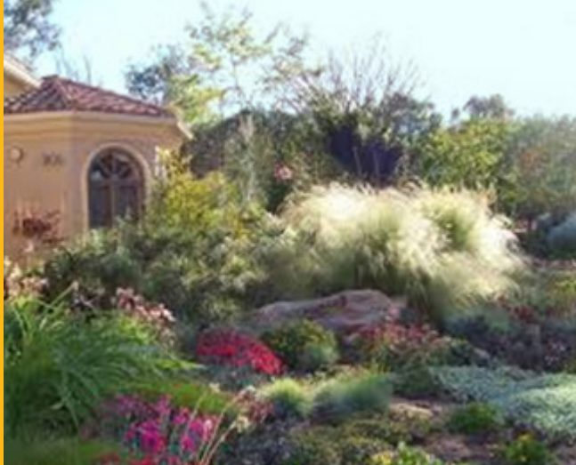
Figura 8. Hermosos paisajes resistentes a la sequía ahorran agua y tiempo.

Tenga en cuenta que el sistema de riego es realmente el que desperdicia el agua, no las plantas. Esto es particularmente cierto respecto a los sistemas de aspersores que se usan para regar céspedes y cubiertas vegetales. Evite dedicar mucho tiempo y mano de obra solo para descubrir que la causa original del su desperdicio de agua continúa existiendo. Aun cuando los céspedes de temporada fría no son resistentes a la sequía, los de temporada de calor requieren de la misma cantidad de agua como muchas otras plantas. Para reducir el desperdicio de agua y mejorar el desempeño de los céspedes, mantenga una distribución uniforme de agua en todo el césped.