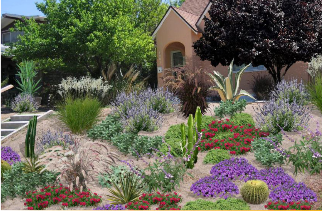
Figura 9. Un paisaje sobre una pendiente que cuenta con un eficiente riego de goteo y mantillo minimiza el escurrimiento de agua.