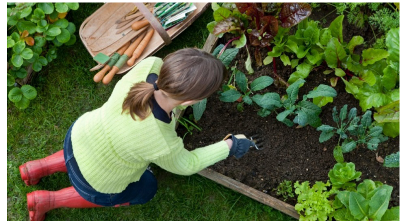
Figura 7. Plante solo las verduras favoritas de la familia y evite un huerto que sea más grande que sus necesidades.

Mezclar acondicionadores de tierra orgánicos (como la composta) de manera uniforme en la tierra del jardín con una profundidad de 6 pulgadas a 1 pie ayuda a retener la humedad en el área de raíces de la planta, lo cual puede significativamente extender los intervalos entre un riego y otro antes de que se desarrollen los síntomas de sequía. Aun cuando la planta siga requiriendo la misma cantidad de agua, extender el tiempo que la planta puede aguantar