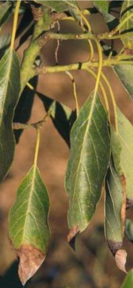
Figura 1. El daño que le causa la sal a un aguacate puede parecerse al daño por sequía.