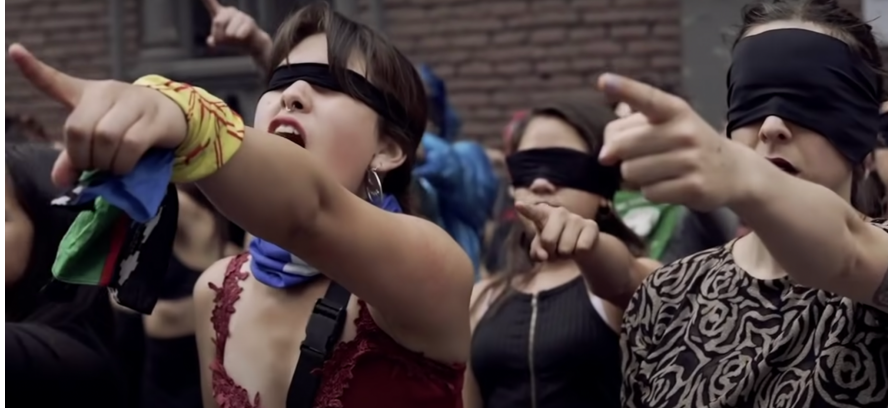
Imagen 2 (Youtube, Colectivo Registro Callejero, 2019)

Esto puede significar muchas cosas. Por ejemplo, el uso del pañuelo puede considerarse un comentario irónico, que se burla de la noción de la que “Justicia es ciega”, es decir trata todos y todas por igual, pero, claramente, esto no aplica cuando se trata de las mujeres. Para las mujeres, no existe la justicia como se representa en la imagen 3. También puede significar el proceso del secuestro, ya que Las Tesis también hablan de las desapariciones.