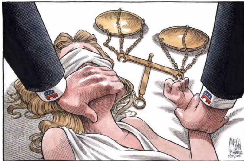
Imagen 3 Parte del activismo digital incluye dibujos y memes que pueden ser publicados en las redes sociales. Está imagen enseña como Señora Justicia/ Lady Liberty es silenciada. Este dibujo trata de violencia sexual y fue viralizado en Twitter, después de que salieran a

Esto puede significar muchas cosas. Por ejemplo, el uso del pañuelo puede considerarse un comentario irónico, que se burla de la noción de la que “Justicia es ciega”, es decir trata todos y todas por igual, pero, claramente, esto no aplica cuando se trata de las mujeres. Para las mujeres, no existe la justicia como se representa en la imagen 3. También puede significar el proceso del secuestro, ya que Las Tesis también hablan de las desapariciones.