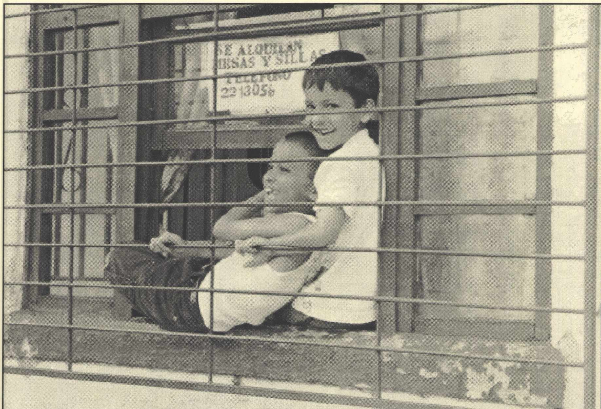
Fotografía 3: "Tras las rejas"

Estos dos jovencitos, quienes viven en un hogar para huérfanos en un barrio pobre de San José, Costa Rica, observan la vida cotidiana a través de rejas: las mismas que los mantienen seguros adentro del viejo casón donde viven y mantienen fuera, ojalá, a los muchos vándalos que amenazan el barrio.